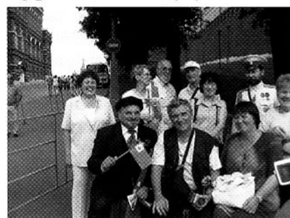
Antaŭ la forveturo en Moskvo: Fotado kun „Lenin“ kaj aliaj konataj personoj de la rusa kaj sovetia historioj.

Ĉiam, kiam mi lanĉas iun malproksiman vojaĝon, mi komencas cerbumi pri ĝia alloga kaj ĝia intereso, ĝia neceso kaj ĝia utilo. Certe mi pripensas ankaŭ